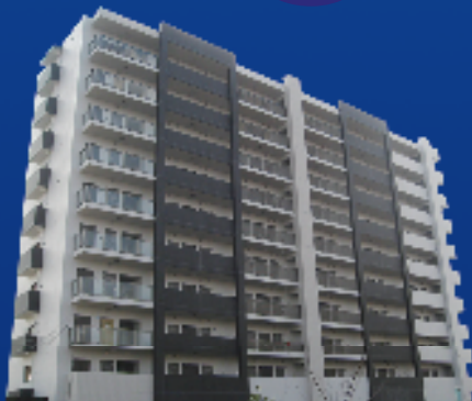
モデルルーム公開中!